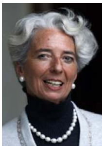
Christine Lagarde Ministre de l'Économie, des Finances et de l'Emploi

Les experts-comptables, les PME et le Gouvernement ont de nombreux projets en commun. Parmi eux, le meilleur accès des PME à la commande publique constitue l'une de mes actions prioritaires.